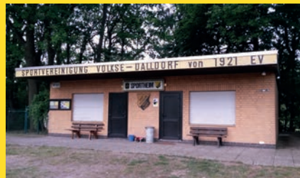
Sportheimbau Es hat sich viel getan, es geht voran und es gibt zahlreiche Unterstützung.