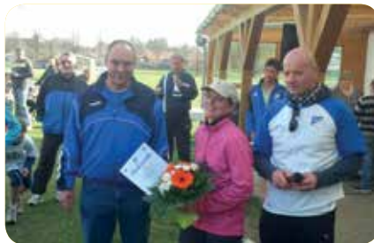
Seite 11 ... Bei zahlreichen Volksläufen waren Volkser und Dalldorfer vorne mit dabei.