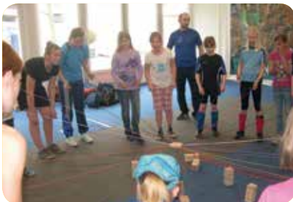
Seite 12...der JFV zeigt sich auch in 2013 besonders aktiv und vielseitig!