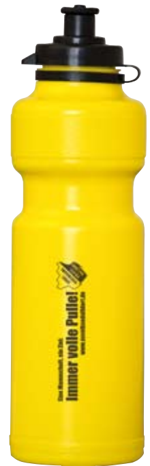
0,8 Liter Trinkflasche

Unterstützen Sie uns und bekennen Sie Farbe. Erwerben Sie Artikel rund um den Verein, besuchen Sie uns zahlreich bei den Spielen und überzeugen Sie sich vom neuen Geist der SV Volkse-Dalldorf.