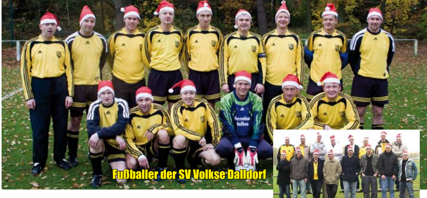
Fußballer der SV Volkse Dalldorf